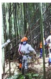
徐々に明るくなってきました