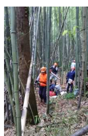
そしてきれいになってきました