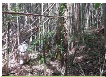
作業前 まるでジャングルです