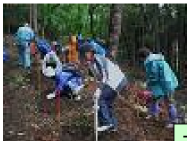
一般参加者植樹風景