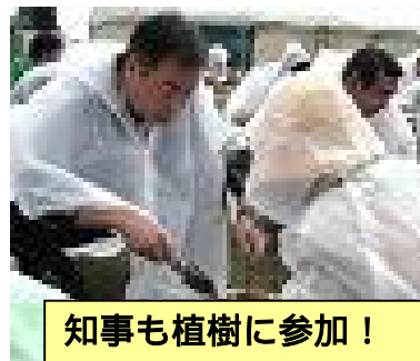
知事も植樹に参加！