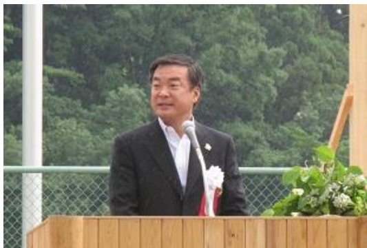
主催者として、松沢知事のご挨拶