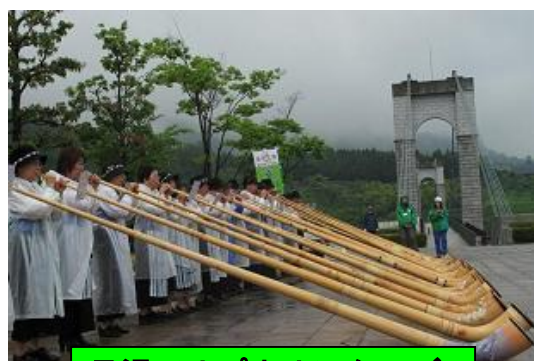
丹沢アルプホルンクラブ