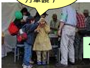
グッズ販売のお店