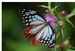
アサギマダラ(箱根大涌谷)

登山日: 8月16日(月) 晴れ コース: 西丹沢～白石峠から加入道山～大群(室)山～犬越路～西丹沢 (記 4期 堀江)