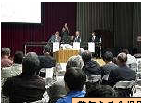
熱気ある会場風景

さらに第2期の5年間計画(骨子案)に対して批判も含め意見を吸い上げ、よりよい施策につなげようとしております。会員の皆様には水源環境保全・再生県民会議や県民フォーラムなどの言葉が飛び交い分かり難いことも多いと思います。今回の報告とは別に改めて、説明させて頂きます。最後になりましたが忙しい中、駆けつけて頂きました多くの会員の方々には深く感謝いたします。