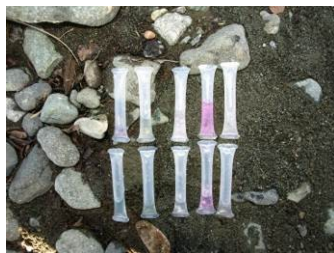
上流と下流を比較しました

下流…川音川にて テスト結果：2011年12月27日午後1時 水温8℃ 水は透明で匂いなし ・COD化学的酸素要求量 … (1) [ppm] ・アンモニウム態窒素 … 0.2 [ppm] ・亜硝酸態窒素 … 0.005 [ppm] ・硝酸態窒素 … (3) [ppm] ・りん酸態りん … 0 [ppm] ( ) は指標の間から推測したおおよその値