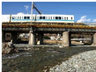
新松田駅近くの川音川にて