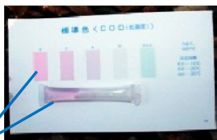
標準色の「0」と同等なので この場所のCODは「0ppm」です

パケットは (株) 共立理化学研究所から調査セットが販売されており、誰でも購入ができます。 5項目 (COD化学的酸素要求量/アンモニウム態窒素/亜硝酸態窒素/硝酸態窒素/りん酸態りん) のスポイト状パックに試薬が入っており、水を吸い上げて反応させ、色を指標と見比べて記録します。