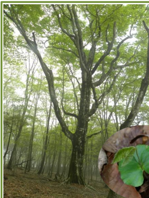
植物班が命名の2代目マザーツリー

松岳雨山稜線のブナ調査(植物班) 丹沢のブナは斜面地に生育していて、1980年代に立枯れが目立つようになりました。衰退は、大気汚染の影響、病虫害や土壌の乾燥化など複合的な要因と考えられています。