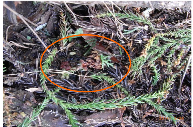
杉の木の下で見つけたムササビの食跡