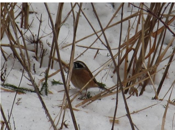
雪のなかのホオジロ。少し寒そうかな?