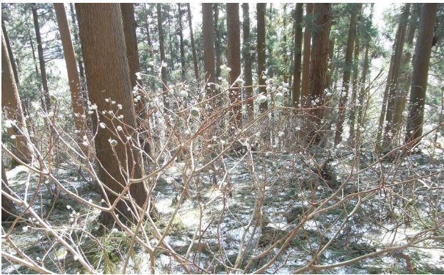
成長の森(20・21)入り口のミツマタ群生地