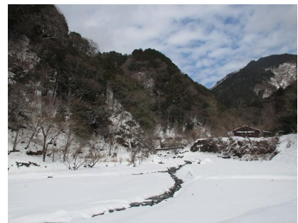
水源林広場から休憩棟の雪景