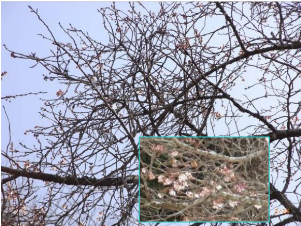
寒さのなかでも咲く、ジュウガツザクラ