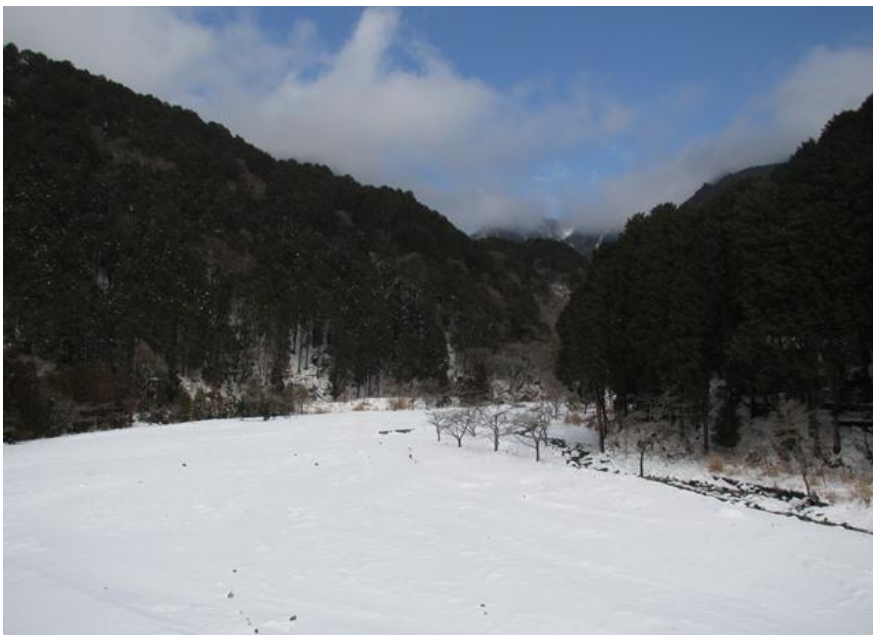
寄大橋からやどりき水源林を望む

2週続けて記録的な大雪となった関東地方ですが、やどりき水源林も白銀の世界となりました。雪で真っ白の世界ですが、雪の中で懸命に生きている動物や植物を見ることが出来ます。ほんの一部ですが、雪の中で見つけた動物や植物をご紹介します。