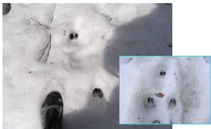
雪道に残る鹿の足跡。蹄の形もハッキリ見えました。