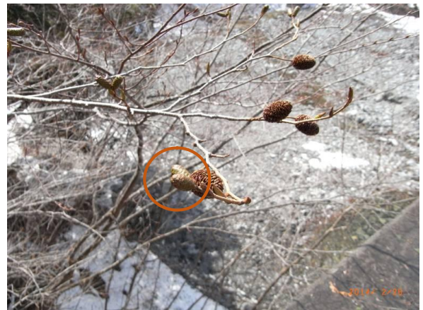
オオバヤシャブシは新しい蕾が出ていました