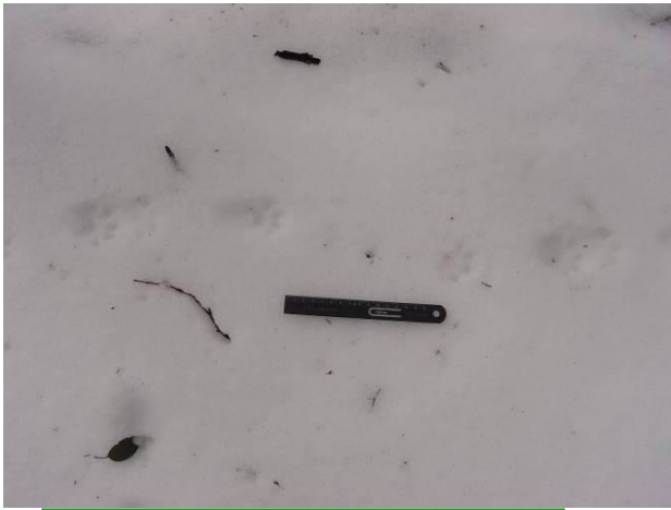
雪道に残る動物の足跡。テンかな？