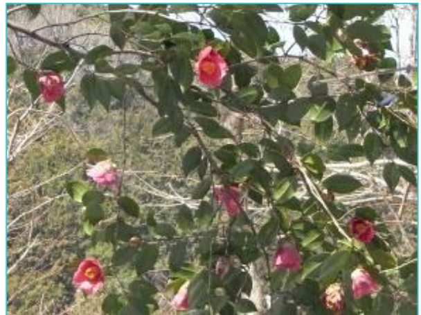
雪の中で鮮やかな赤が映えます。ヤブツバキ