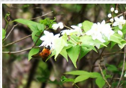
ヒメウツギに来たハナバチの仲間

5月のトピックス 「夏も近い! ウツギ&動物探し」というテーマのイベントも開催されます。土日の定例観察会にもぜひおでかけください。あなたは何種類のウツギの花に会えるでしょう?