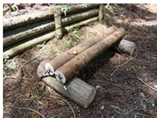
完成したベンチ 切断した丸太を組み合わせて、ベンチを作りました。週遊歩道の良い休憩スポットになりました。