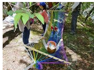
森林癒し体験 木漏れ日のもれる林の中でハンモックの体験をしました。ゆらゆら気持ちよさそう。