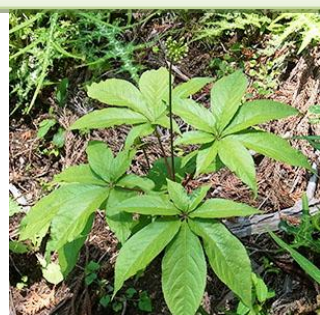
トチパニンジン：中央の茎先の花がもうすぐ開花です。