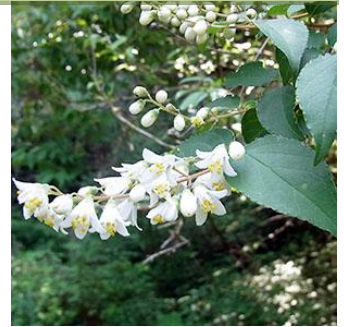
ウツギ：そろそろ開花が始まりました。6月の水源林の主役です。

この時期、ウツギの仲間以外にも、特徴ある花をつける植物を見つけることができます。