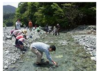
水生生物観察 寄沢の中に入り水生生物の採取を行い、見つけたものにチェックを入れて、ピング大会を行いました。