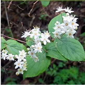
マルバウツギ：5月の水源林を飾ったマルバウツギ。

マルバウツギ、バイカウツギ、ガクウツギ、ニシキウツギなどは、そろそろ花の盛りの終わりです。4月のヒメウツギから始まったやどりき水源林の各種ウツギは、6月に本家ウツギでクライマックスを迎えます。