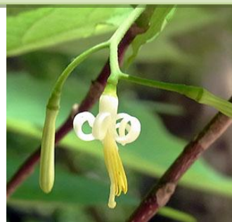
ウリノキ：白い花弁がクルリと巻くユニークな花です。