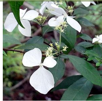
ガクウツギ：装飾花の大きさがばらばらなのが特徴です。