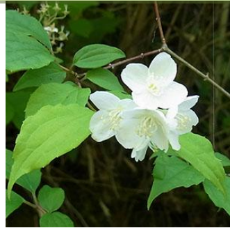
バイカウツギ：バイカ(梅花)の名の通り、梅の花に似ています。