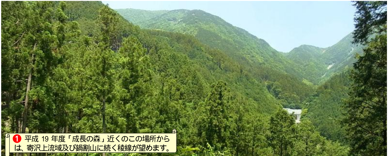
① 平成19年度「成長の森」近くのこの場所からは、寄沢上流域及び鍋割山に続く稜線が望めます。

周遊歩道Aコース途中には、木々の間から遠景を眺めることができるビューポイントがあります。Aコース周遊や、「成長の森」見学の際は、ぜひここからの眺望をお楽しみください。