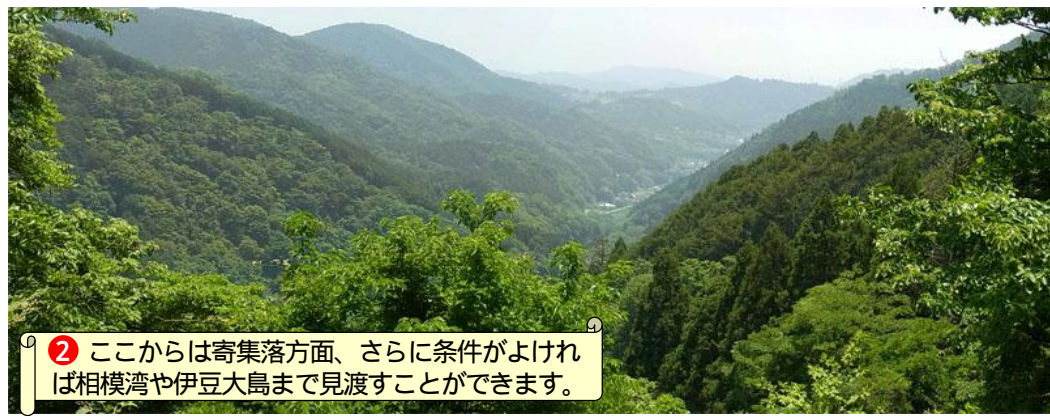
② ここからは寄集落方面、さらに条件がよければ相模湾や伊豆大島まで見渡すことができます。