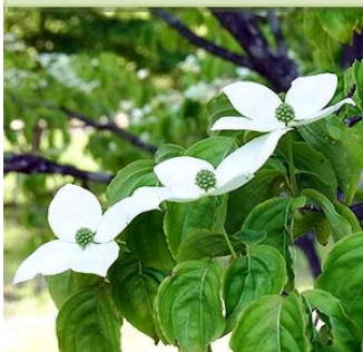
ヤマボウシ：花の白い部分は総苞片で、上向きにつきます。白と緑の葉の取り合わせが美しい。

この時期、ウツギの仲間以外にも、特徴ある花をつける植物を見つけることができます。