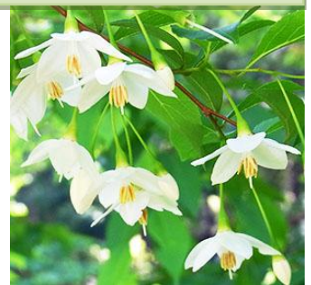
エゴノキ：白い清楚な花が、垂れ下がるように咲きます。