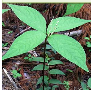
フタリスズカ：2本の花穂が、虚実2人の静御前を連想します。