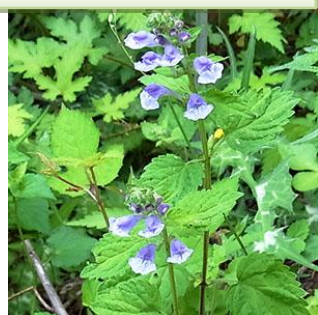
タツナミソウ：比較的日当たりのよい所に咲いています。