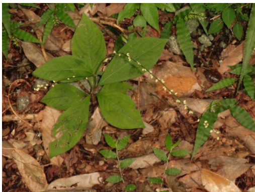
ギンミズヒキも咲いていました