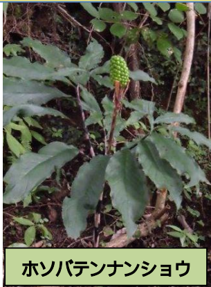
ホソバテンナンショウ