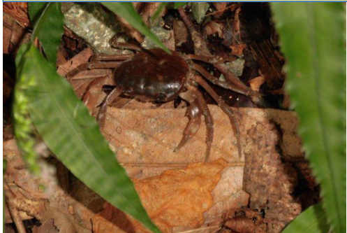
サワガニ登場～！！ 冬のお布団探しかな？