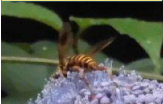
何だか、タマアジサイに夢中みたい