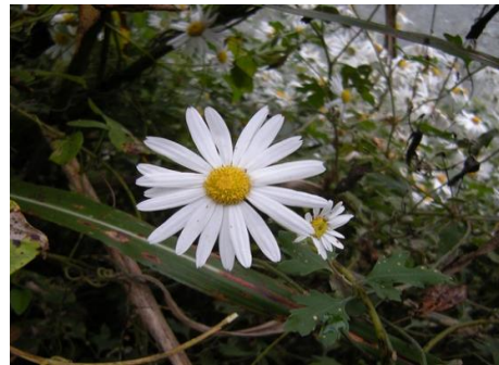
リュウノウギク (キク科)