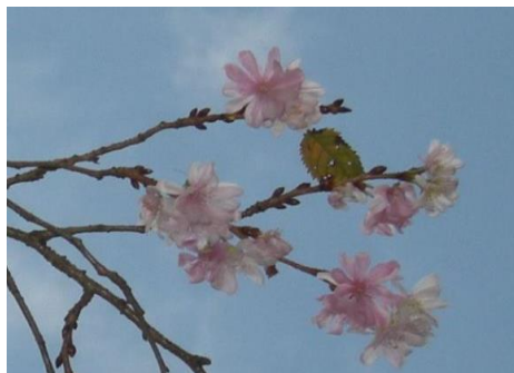
ジュウガツザクラ (バラ科)