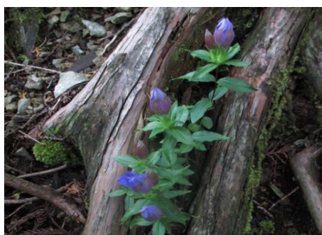
リンドウ (リンドウ科)