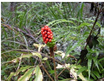
テンナンショウの実 (サトイモ科)