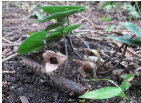
カンアオイ (ウマノスズクサ科)