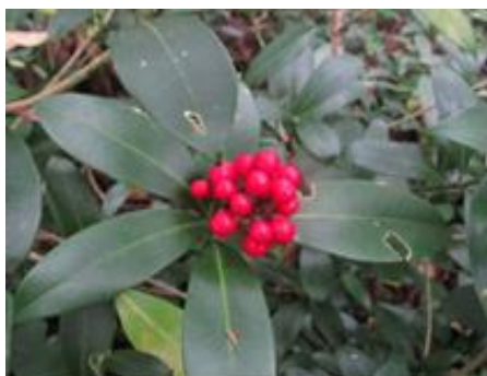
ミヤマシキミの実 (ミカン科)