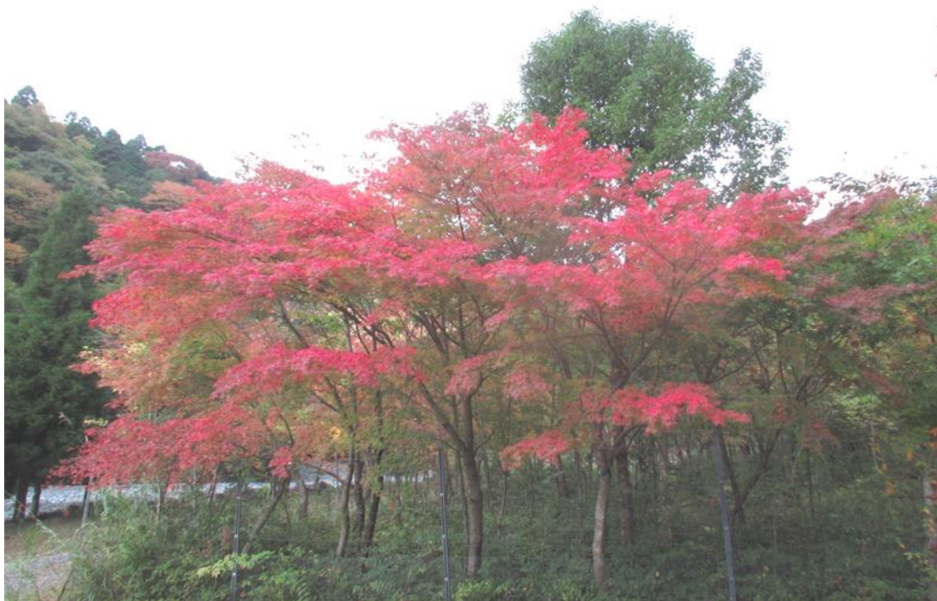
小雨にかすむイロハモミジ