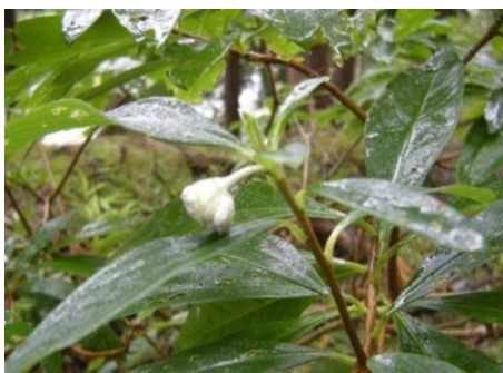
ミツマタの蕾 (ジンチョウゲ科)