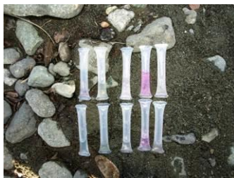
上流と下流を比較しました