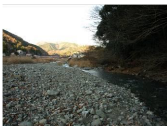
寄集落終点の寄沢にて