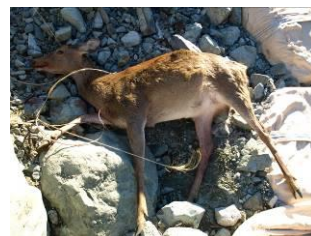
管理捕獲されたニホンジカ

管理計画に関して： http://www.pref.kanagawa.jp/cnt/f986/p10114.html