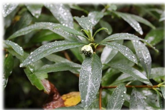
ミツマタ。樹皮が紙幣の原料になります。