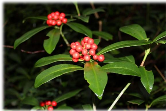
ミヤマシキミ。千両・万両ならぬ億万両の別名を持ちます。