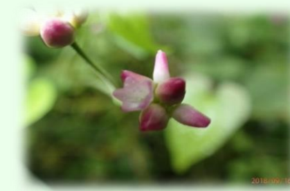
ママコノシリヌグイ