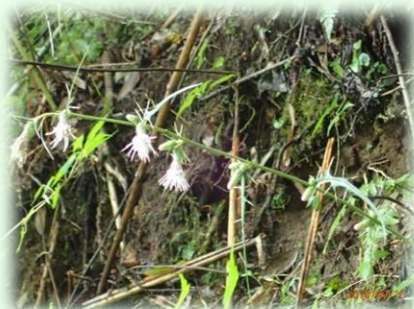
アズマヤマアザミ