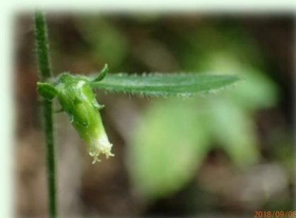
ヒメガンクビノウ