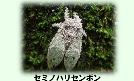
セミノハリセンボン (セミに寄生したキノコの仲間です。)