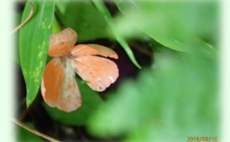
フシグロセンノウ