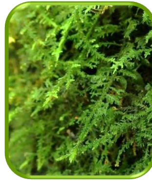
トヤマシノブゴケ