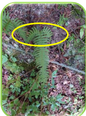
ジュウモンジシダ