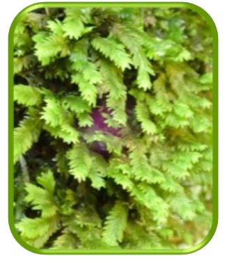
ホウオウゴケの仲間