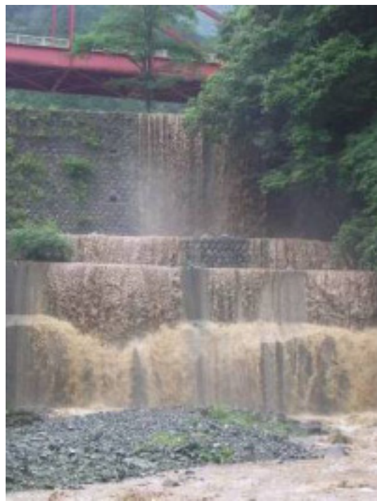
激流に洗われる寄大橋下の大堰堤。上段は昭和15年生まれの石積みで、まだまだ現役です。