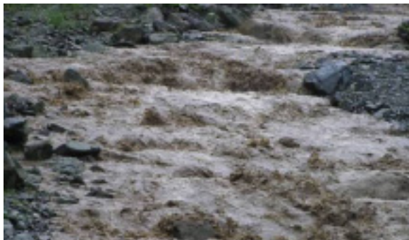
降雨時の寄沢上部。茶色の濁流が渦巻きます。

1923年の関東大震災では、寄地区も丹沢の他の地区と同様に、大規模な山崩れに見舞われました。その後治山治水の努力を積み重ねた結果、現在のような美しい山並みを回復することが出来ました。寄地区は「水源涵養保安林」と共に「土砂流出防備保安林」に指定され、整備が続けられています。寄沢の急流は今でも一旦雨が降ると清流は一変して激しい濁流に変わります。まだまだ治山治水に手を抜くことは出来ません。