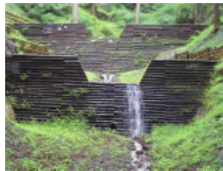
間伐材を型枠に利用した最近の堰堤