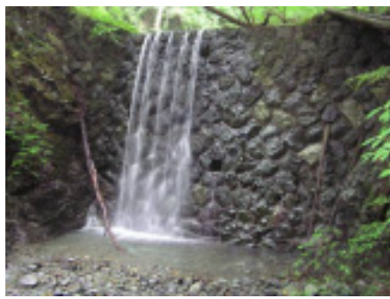
石積みの堰堤。往時の匠の技です。