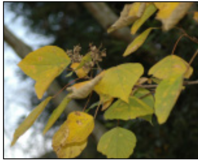
☆アカメガシワの黒い実は、鳥達のご馳走。