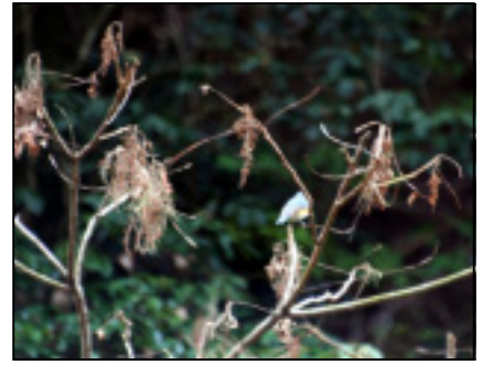
☆ヌルデの実に来たルリビタキ。雄は青とオレンジの色がきれい。

☆下の写真は、ぎっしり広葉樹の葉が入っていたヤマネ用巣箱。ネズミが利用していたと思われます。