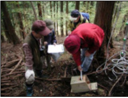
☆森の案内人動物班で、巣箱利用の確認と巣箱の補修をおこないました。