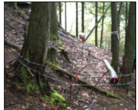
☆野生動物のヘアトラップ。茨線に引っ掛かった毛を調べるのだそうです。バケツの中には蜂蜜が。