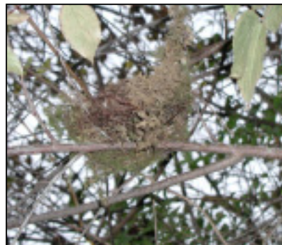
☆苔と小枝で作られた鳥の巣。上の枝から落ちた様。落葉で、隠れていた巣が現れます。