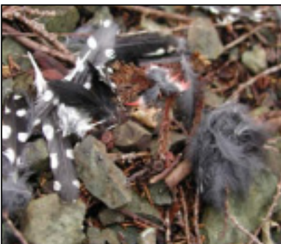
☆森林内にアカゲラの羽根が散乱していました。犯人は誰?