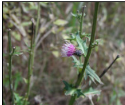
☆ニホンジカに食べられた林道脇のタイアザミ。けなげに1輪咲いていました。(12月6日)