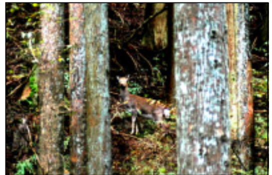
☆Bコースで会ったニホンジカ。3頭いました。最近Bコースで見かけるシカは、この子達でしょうか。(12月6日)