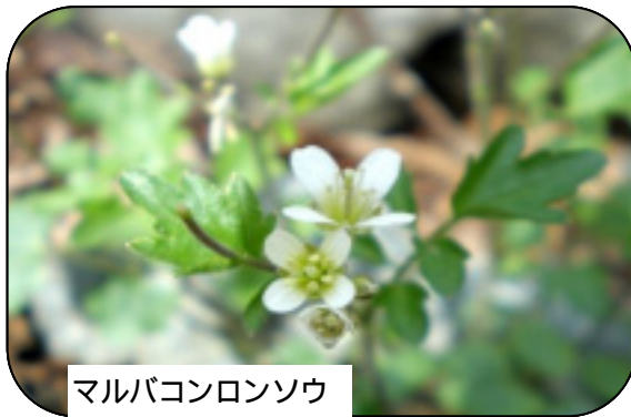
マルバコンロンソウ