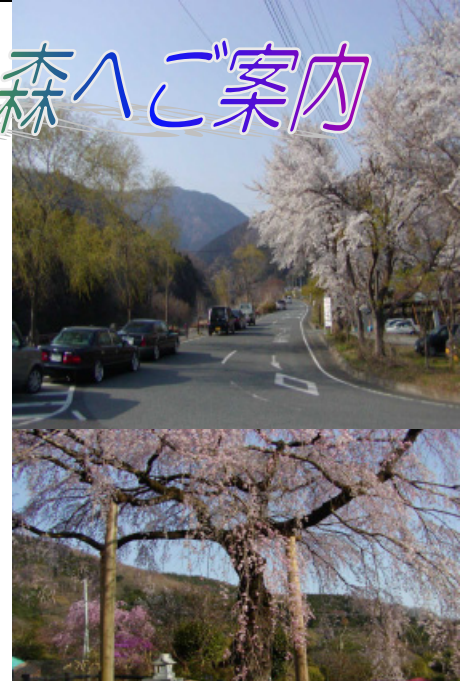
(土佐原のしだれ桜)

水源林の玄関、やどりきの里は春らんまん、高台にある土佐原のしだれ桜は見事でした。中央の桜はビジターセンターです。バス停横の林道に向かう道路はいつも河原で憩う人たちの車がいっぱいです。