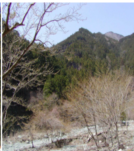
(河原の向う正面山の中腹が成長の森)