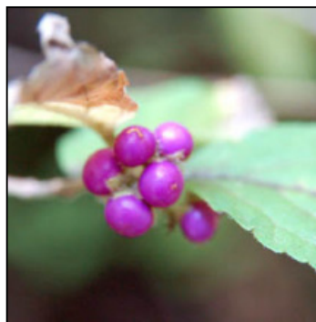
ヤブムラサキの果実 毛が密生したガク片に包まれる