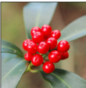
ミヤマシキミの果実 有毒なので要注意

県の主導で始まった成長の森も又しっかりとやどりきに根を下ろし木々として育まれていき次世代への新しい森としての役割を担っています。