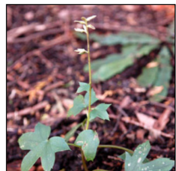
モミジガサの花 茎の先に小さな花が咲く