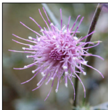
タイアザミの花 この時期当地で多く見られる