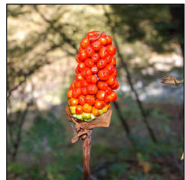
マムシグサの果実 赤い果実がよっきり立つ