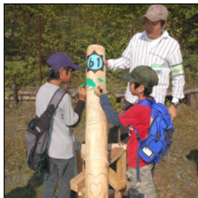
森のバトン リレーフェスタの各行事毎に順番に色塗りを行い、植樹祭で完成します。