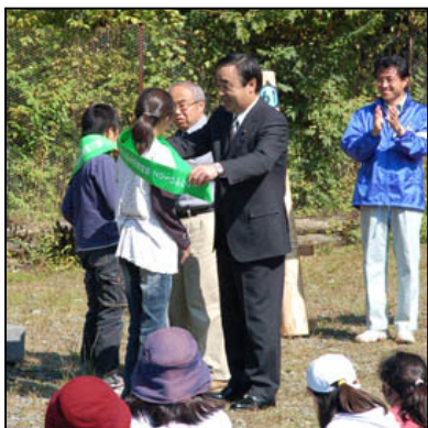
緑のたすき引継式 リレーのたすきが子どもたちに渡され、森のリレーフェスタが始まりました。

また、成長の森では、広葉樹の植樹を多くの方々の参加で実施しました。そして、例年通り、水源林トレッキング、クラフト作成、森の音楽会、水生生物観察、などが行われ、にぎやかな一日となりました。