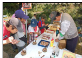
クラフトコーナー