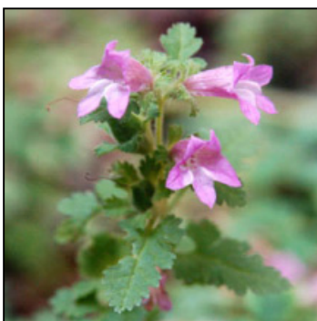
コシオガマの花 花はピンクで内部は白っぽい