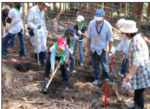
成長の森では、みどりの少年団や一般参加者の皆さんで植樹が行われました。