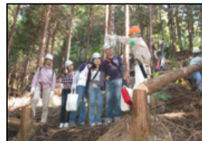
トレッキング：木こりコース