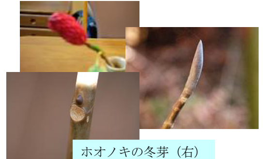
ホオノキの冬芽 (右) 果実(左上)葉痕(左下)