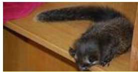
県立自然環境保全セ ンターに保護された 赤ちゃんムササビで す。水源林にも生息 しています。