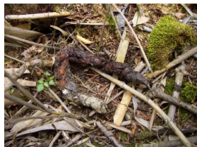
テンの高ゲリ 石の上、高台、道の真ん 中、目立つ所に糞をしま す。テリトリーの誇示と か他の動物に襲われな いためようです。