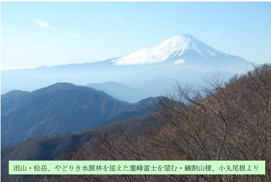
雨山・桜岳、やどりき水源林を従えた霊峰富士を望む・鍋割山稜、小丸尾根より

静かな水源林が戻ってきました。空気が澄み富士山が一年で一番素晴らしく見えるシーズンになりました。静かに感じる水源林も実は躍動しているのです。春一番を狙って冬芽の活動が活発になるのもこの季節。水源林にもぐりこみ、色々な魅力を探ってみてはいかがでしょうか？