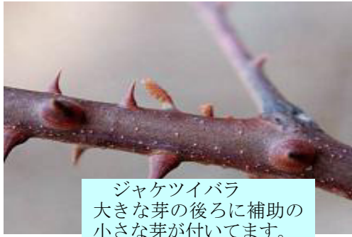
ジャケツイバラ 大きな芽の後ろに補助の 小さな芽が付いています。