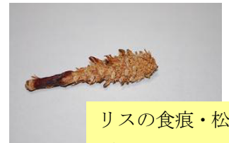
リスの食痕・松 ぼっくりです。