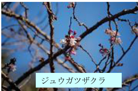
ジュウガツザクラ

静かな水源林が戻ってきました。空気が澄み富士山が一年で一番素晴らしく見えるシーズンになりました。静かに感じる水源林も実は躍動しているのです。春一番を狙って冬芽の活動が活発になるのもこの季節。水源林にもぐりこみ、色々な魅力を探ってみてはいかがでしょうか？