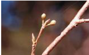
アブラチャン葉芽・花芽