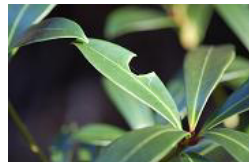
誰が食べたんでしょう