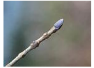
上：カツラ 斜：アオダモ 右：キブシ