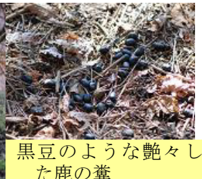
黒豆のような艶々し た鹿の糞