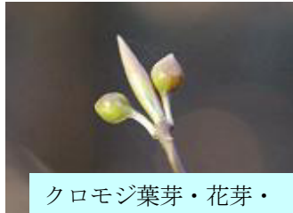
クロモジ葉芽・花芽・