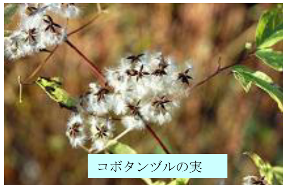
コボタンヅルの実