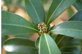
ミヤマシキミ・左 雄花・ 右 雌花