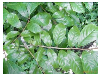
ダンコウバイ (落葉)