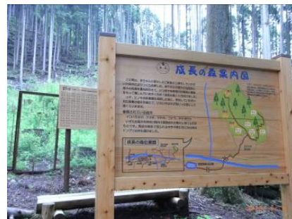
21年度の成長の森 (入口の案内板)