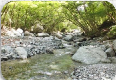
溪流ではどのような石があるのかな？