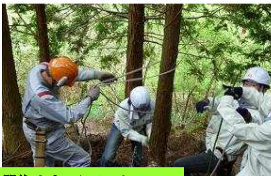
間伐はチームワークで！！

なによりも、新鮮な空気とやさしい緑の中での静かな一日は、参加者全員に安らぎを与え、心身をリフレッシュさせています。