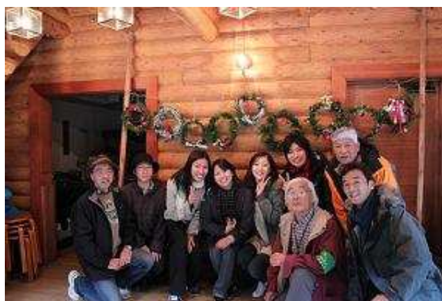
クリスマス・リース作り