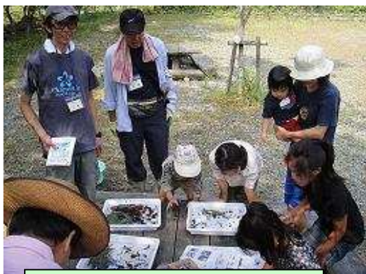
子供たちに人気の水棲生物観察