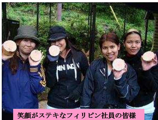
笑顔がステキなフィリピン社員の皆様

新入社員の間伐研修は、新社会人たちにチームワークの大切さを教える良い機会となっています。