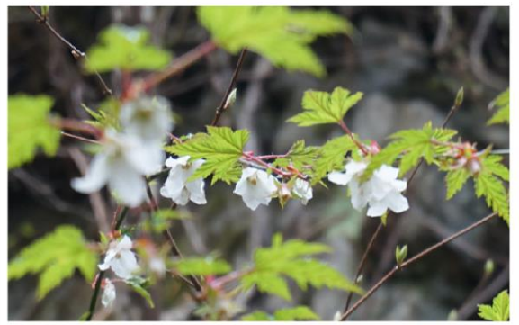
モミジイチゴ 6月にはとてもおいしい 黄色い実がなります。