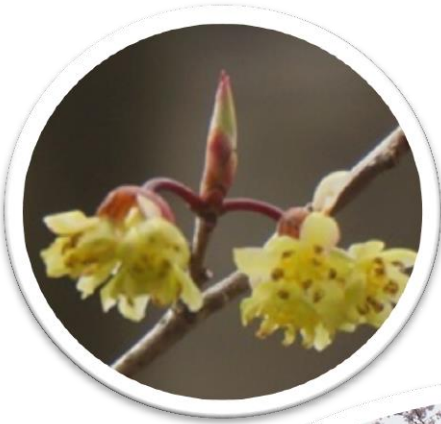
クロモジ チアガール。 両手にボンボンを持って フレ〜！フレ〜！