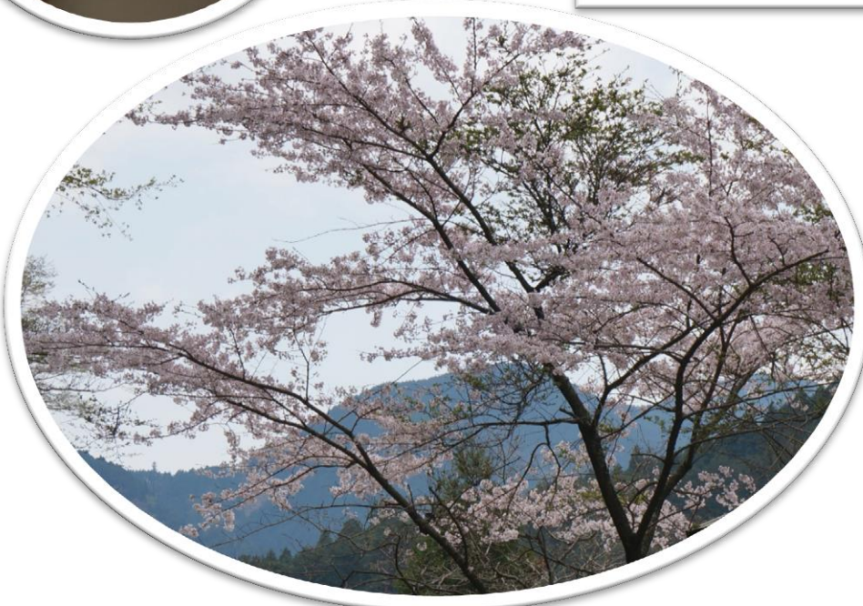
ソメイヨシノ 水源林は街中より 2、3℃気温が低いので、 その分ちょっと遅れて 満開です。