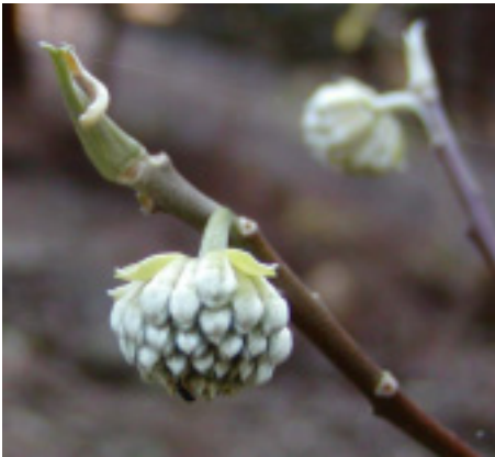
ミツマタの冬芽と蕾

早春に花が咲くミツマタ、ダンコウバイ、クロモジ、アブラチャンなどの冬芽はもう膨らんでいます。ホウの冬芽は大きく目に留まります。やどりき水源林の冬は、冬芽の観察に最適な時期です。