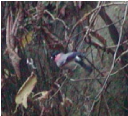
喉が赤いウソの雄