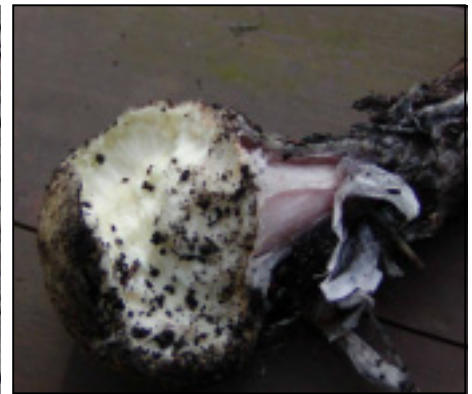
ネズミの食痕か (マムシグサの球茎)